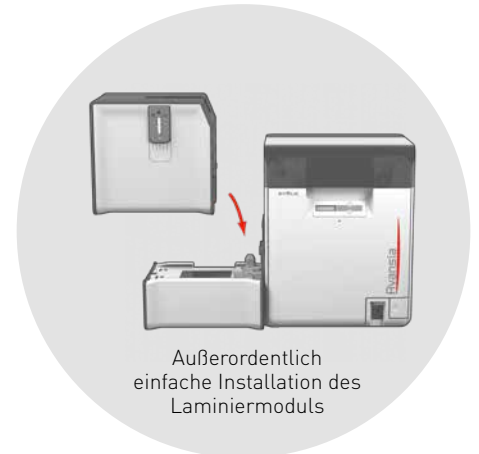
Außerordentlich einfache Installation des Laminiermoduls